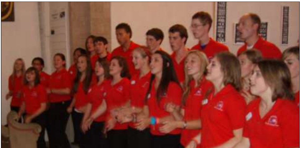
Die Ambassadors of Music – gern gesehene, klanglich faszinierende Gäste aus den USA