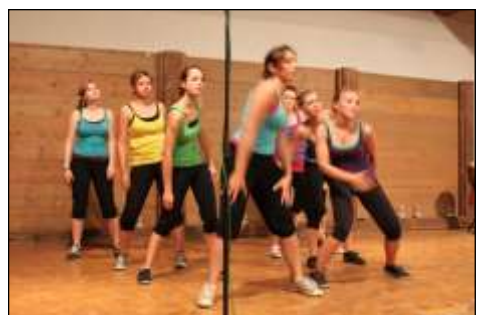
Tanz- und Gymnastikstudio Liebisch