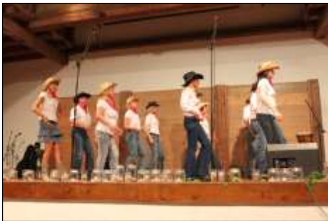
Linedance-Gruppe Apple Jacks