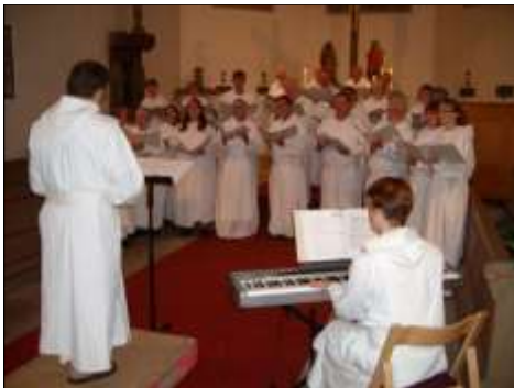
Ephrata Cloister Choir – geistliche deutschamerikanische Klostermusik ganz eigener Art